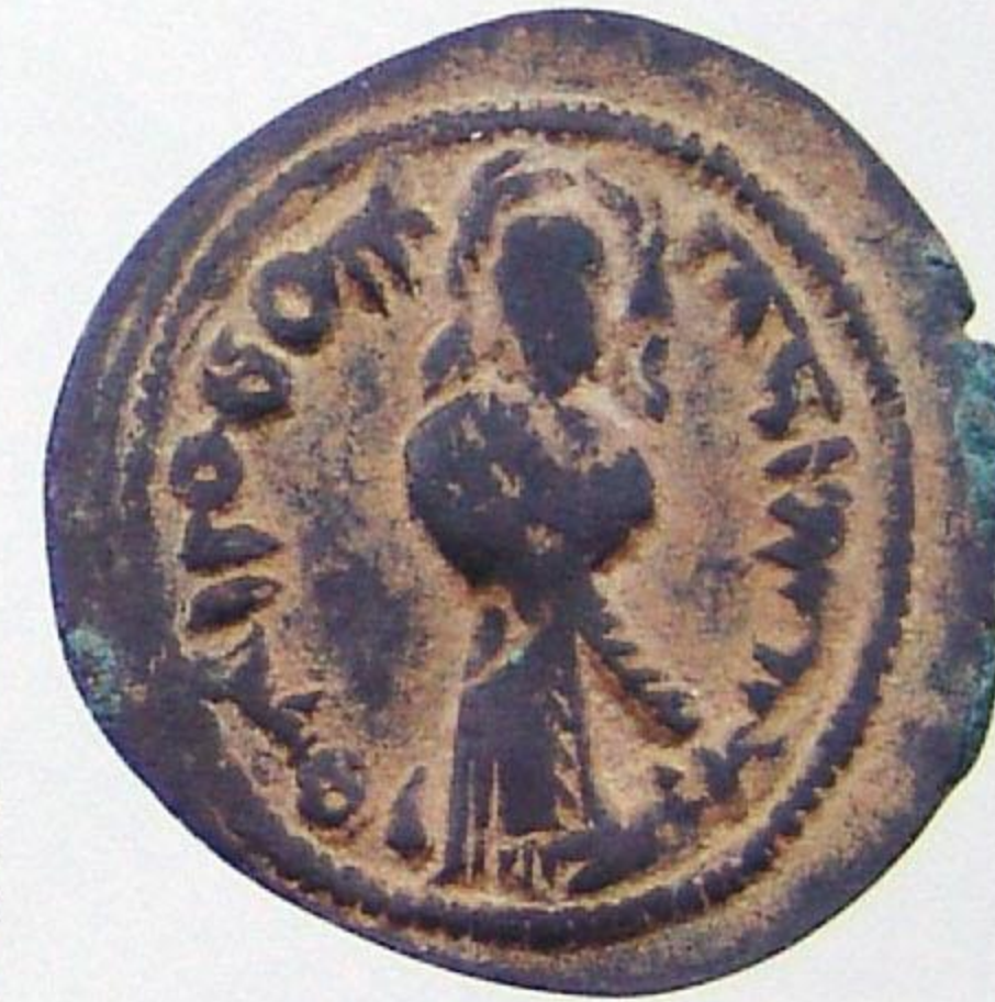
فلس عربي بيزنطي عبد الملك بن مروان ضرب: حمص